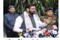
अद्वैत इमीग्रेशन को लेकर हरियाणा सरकार बनाएगी...

दिल्ली-एनसीआर, उत्तर प्रदेश, हरियाणा, राजस्थान और चंडीगढ़ से एक साथ प्रसारित