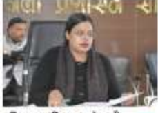
हरियाणा महिला आयोग की उपाध्यक्ष बख्शित...