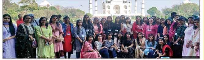
विद्यार्थियों के साथ कॉलेज स्टाफ।