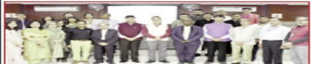
अग्रवाल कॉलेज का बाहरी मूल्यांकन करने पहुंची टीम।

बल्लभगढ़, 16 मार्च, सत्यजय टाइम्स/गोपाल अरोड़ा। अग्रवाल महाविद्यालय बल्लभगढ़ में "राष्ट्रीय मूल्यांकन प्रत्यायन परिषद" के अंतर्गत