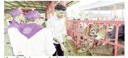
गौरवला में गानों को चार व गुड़ खिलाया स्वयंसेवक।