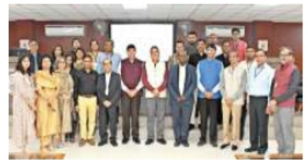
पाणनियर समाचार सेवा। फरीदाबाद

पीपीटी के माध्यम से अनेक प्रस्तुतियों का अवलोकन कर और बेहतर करने के लिए प्रेरित किया