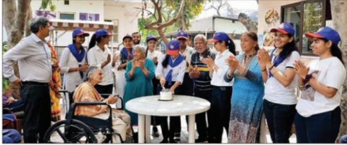
अंगदान महादान के लिए जागरूक करते हुए।

दूसरे सत्र में स्वयंसेवकों ने गौरवला जकार ब्रम्हदान किया और गानों को चार और गुड़ खिलाया। तीसरे सत्र में नया मुक अंगदान के जटिल पोस्ट और स्लोगन प्रतिस्पर्धियों