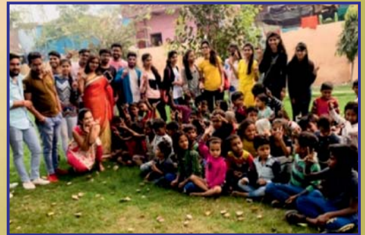
N.S.S Volunteers during the camp 'Swachhh Bharat Abhiyaan'