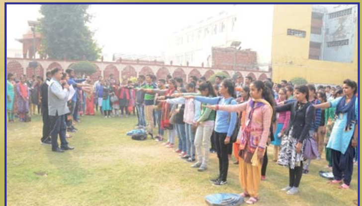
Students taking Oath during Anti-tobacco campaign