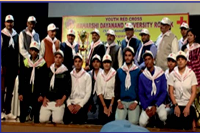
YRC Team felicitated by VC, M.D. University, Rohtak for winning Sir Jean Henry Dunant Trophy (Best Institution Trophy) for outstanding work during the Session: 2017-18.