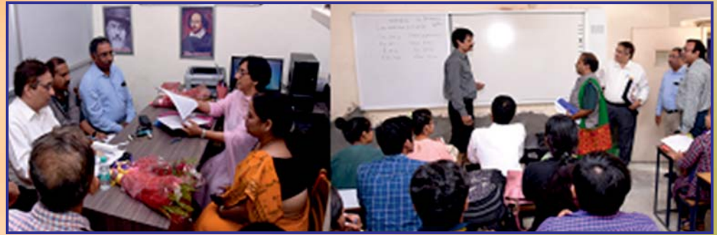
The Team of Internal Audit visited the College

अग्रवाल महाविद्यालय बल्लबगढ़ को 313 सौर ऊर्जा प्लांट स्थापित करने एवं स्वच्छता के अन्य आयाम स्थापित करने के लिए "ग्रीन सर्टिफिकेट अवार्ड" से नवाज़ा गया है।